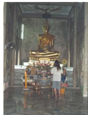
พระประธานภายในอุโบสถ