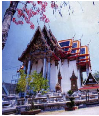
พระอุโบสถวัดจุฬามณี

ประตูหน้าต่างมีลายฉลุรูปเทวดาประดับมุก บริเวณยอดปราสาทประดับด้วยกระจกสี รอบๆ พระอุโบสถทั้ง 4 ด้าน มีศาลาพัก และกุฏิทรงไทยหลายหลัง