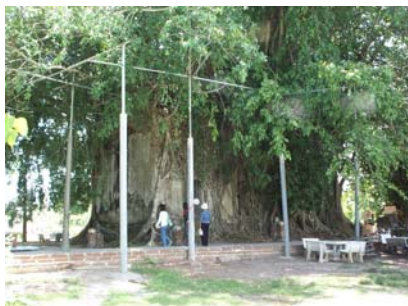
อุโบสถที่ถูกปกคลุมด้วยต้นโพธิ์และต้นไทร

วัดบางกุ้ง ตั้งอยู่ที่ตำบลบางกุ้ง อำเภอบางคนที พื้นที่วัดมีถนนตัดผ่านกลาง ทำให้ภูมิทัศน์ ศาลาการเปรียญ กับพระอุโบสถอยู่กันคนละด้าน ทางด้านที่เป็นพระอุโบสถมีพระอุโบสถปรกโพธิ์อายุ กว่า 100 ปี มีต้นโพธิ์และต้นไทรปกคลุมอยู่ พระอุโบสถปรกโพธิ์นี้ ประดิษฐานพระพุทธรูปหลวงพ่อนิล มณี มีภาพจิตรกรรมฝาผนังที่สวยงามแต่ลบเลือนเกือบหมด ใกล้กับพระอุโบสถปรกโพธิ์เป็นอนุสาวรีย์ สมเด็จพระเจ้าตากสินมหาราชประทับนั่ง ถัดไปเป็นพระอุโบสถหลังใหม่ ภายในกุฏิเจ้าอาวาสมีพระบรม รูปจำลองสมเด็จพระเจ้าตากสินมหาราชขนาดเท่าองค์จริง มีพิพิธภัณฑ์อาวุธในสมัยที่พระองค์รวบรวม ไพร่พลต่อสู้กับพม่า เพื่อกอบกู้เอกราช ของส่วนใหญ่ที่เก็บไว้ชุดพบในบริเวณค่ายบางกุ้ง ซึ่งสร้างขึ้น เพื่อรับมือกับทหารพม่า เมื่อ พ.ศ.2307 แต่ถูกพม่าตีแตก จนกระทั่งสมเด็จพระเจ้าตากสินมหาราชทรง กอบกู้เอกราชและขับไล่ทหารพม่าออกไป จึงมอบกำลังทหารชาวจีนให้อยู่ประจำค่ายนี้เพื่อระวังรักษา เมืองสมุทรสงครามและเมืองราชบุรี โดยใช้วัดบางกุ้งเป็นศูนย์กลางค่าย หลักฐานที่เหลืออยู่ปัจจุบันคือ เสาเขต สระน้ำ และวัดบางกุ้ง