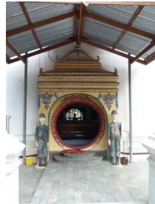
ประตูทางเข้าพระอุโบสถ

วัดเขายี่สาร ตั้งอยู่บนภูเขาเตี้ยๆ ในหมู่บ้านเขายี่สาร ภายในประกอบด้วยโบราณสถานที่มีอายุเก่าแก่ ทั้งวิหาร พระอุโบสถและกุฏิสงฆ์ ในวิหารนั้นมีรอยพระพุทธรูปบาทและมณฑปครอบอยู่ บานประตูวิหารทั้งสองด้านแกะสลักลงรักปิดทอง บานซ้ายมีลวดลายลักษณะเป็นแบบจีน ส่วนบานขวามีลวดลายเป็นแบบไทย ตรงพื้นที่ว่างระหว่างประตู 2 บาน มีพระพุทธรูปแกะสลักปางห้ามสมุทร มีภาพจิตรกรรมฝาผนังเรื่องราวเกี่ยวกับเทพเจ้าจีนอยู่ที่หน้าต่างพระอุโบสถ บริเวณรอบๆ วิหารและพระอุโบสถมีหอรบซังเก่า วิหารราย และเก๋งจีน นอกจากนี้ยังมีพิพิธภัณฑสถานบ้านเขายี่สาร เริ่มก่อตั้งเมื่อ พ.ศ.2539 ด้วยความร่วมมือร่วมใจของชาวชุมชนยี่สารที่มีความสำนึกในประวัติศาสตร์ความเป็นมาของท้องถิ่น อาคารชั้นล่างจัดแสดงภูมิปัญญาบ้านเขายี่สาร ชีวิตวัฒนธรรมของผู้คน เครื่องมือผลิตยาสมุนไพร เครื่องใช้ไม้สอยของชาวบ้านในชุมชน ชั้นบนจัดแสดงภาชนะ เครื่องมือเครื่องใช้ของชาวชุมชนเขายี่สาร