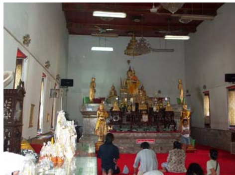
หลวงพ่อบ้านแหลม

วัดเพชรสมุทรวิหารหรือวัดบ้านแหลม ตั้งอยู่ตำบลแม่กลอง อำเภอเมืองสมุทรสงคราม เป็นที่ประดิษฐาน “หลวงพ่อบ้านแหลม” พระพุทธรูปปางอุ้มบาตรขนาดเท่าคนจริงสมัยสุโขทัย ซึ่งเป็นพระพุทธรูปสำคัญของจังหวัด ตามตำนานกล่าวว่าชาวบ้านแหลมที่อยู่ในเขตเมืองเพชรบุรีได้อพยพหนีพม่าเข้ามาตั้งถิ่นฐานในตำบลแม่กลอง ทางด้านเหนือของวัดศรีจำปา จึงเรียกหมู่บ้านนี้ว่า “บ้านแหลม” และช่วยกันบูรณะวัดศรีจำปา จากนั้นจึงเรียกชื่อวัดใหม่ว่า “วัดบ้านแหลม” ซึ่งประดิษฐานหลวงพ่อบ้านแหลม ที่ถือเป็นพระพุทธรูปคู่บ้านคู่เมืองของจังหวัดสมุทรสงคราม