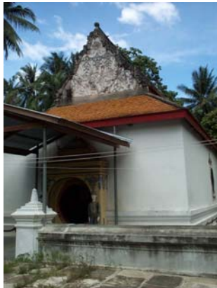
หน้าบันพระอุโบสถ