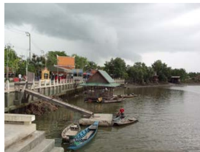
ท่าเรือหน้าวัดเขายี่สาร

วัดบางแคใหญ่ ตั้งอยู่ริมแม่น้ำแม่กลอง สร้างขึ้นเมื่อ พ.ศ.2357 ภายในวัดมีโบราณสถานและโบราณวัตถุที่น่าสนใจ ได้แก่ พระอุโบสถหลังใหญ่อายุกว่า 150 ปี ด้านหน้ามีเจดีย์เหลี่ยมย่อมุมสิบสอง ศิลปะสมัยกรุงศรีอยุธยา พระประธานในอุโบสถปั้นด้วยศิลาแลง ปางมารวิชัย ด้านหน้าพระอุโบสถมีธรรมเจดีย์ 7 องค์ สร้างเมื่อ พ.ศ.2415 มีกำแพงแก้วล้อมรอบ และมีภาพจิตรกรรมฝาผนังบนฝาประจัน กุฏิสงฆ์ ที่เขียนด้วยสีฝุ่นผสมกาวเขียนขึ้นในปลายรัชกาลที่ 2 เป็นภาพเรื่องราวการทำสงครามไทย-พม่า