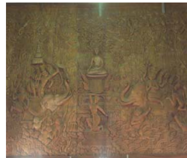
วัดบางแค่น้อย และภาพแกะสลักไม้ภายในอุโบสถ

วัดพวงมาลัย เป็นสถานที่หนึ่งที่มีรัชกาลที่ 5 ทรงเสด็จประพาสต้น มีสิ่งที่น่าสนใจคือ ธรรมมาสน์บุษบก บานประตูและหน้าต่างพระอุโบสถลวดลายนูน และเจดีย์หงสาวดี