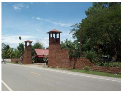
ค่ายบางกุ้ง