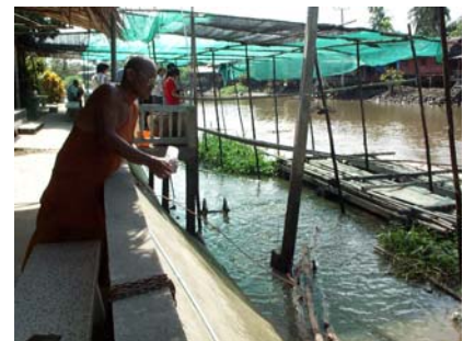
วังมัจฉา

วัดอินทาราม ตั้งอยู่ที่ตำบลเหมืองใหม่ เป็นวัดโบราณ สร้างเมื่อ พ.ศ.2300 ในสมัยกรุงศรีอยุธยา แต่มาปฏิสังขรณ์ใหม่ในรัชกาลที่ 3 สิ่งที่น่าสนใจภายในวัดได้แก่ พระพุทธรูปหลวงพ่โตอายุกว่า 300 ปี พระอุโบสถสร้างด้วยหินอ่อนทั้งหลัง บานหน้าต่างและบานประตูเป็นไม้สัก แกะสลักสุภาพชิตสอนใจ มีพิพิธภัณฑวัตถุโบราณ อุทยานปลาดะเพียน และศูนย์ฟื้นฟูสภาพจิตใจ ที่ใช้สมุนไพรควบคุมกับการปฏิบัติธรรมรักษาผู้ติดยาเสพติด