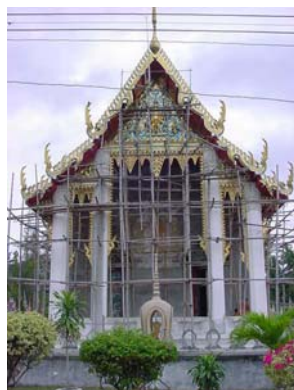
พระอุโบสถวัดพวงมาลัย

วัดพวงมาลัย เป็นสถานที่หนึ่งที่มีรัชกาลที่ 5 ทรงเสด็จประพาสต้น มีสิ่งที่น่าสนใจคือ ธรรมมาสน์บุษบก บานประตูและหน้าต่างพระอุโบสถลวดลายนูน และเจดีย์หงสาวดี