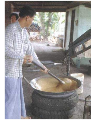
การสาธิตการทำน้ำตาลมะพร้าว

เตาตาล ตั้งอยู่ริมถนนสายสมุทรสงคราม-อัมพวา เป็นแหล่งผลิตน้ำตาลมะพร้าว ซึ่งเป็นอาชีพสำคัญของชาวสมุทรสงคราม มีการสาธิตขั้นตอนวิธีการทำน้ำตาลมะพร้าว จำหน่ายน้ำตาลมะพร้าวและผลิตภัณฑ์จากกะลามะพร้าว ปัจจุบันมีเตาตาลให้เที่ยวชม 5 แห่ง ได้แก่ เตาตาลหวาน เตาตาลดี เตาทวิ เตากาหลง และเตาไทย