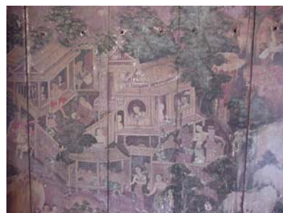
ภาพจิตรกรรมฝาผนัง