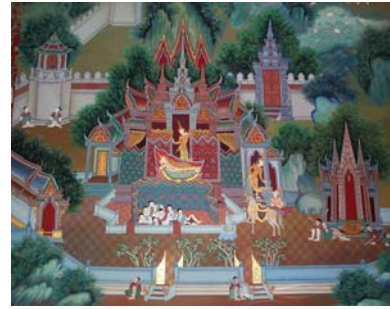
จิตรกรรมฝาผนังภายในพระอุโบสถวัดจุฬามณี

วัดอินทาราม ตั้งอยู่ที่ตำบลเหมืองใหม่ เป็นวัดโบราณ สร้างเมื่อ พ.ศ.2300 ในสมัยกรุงศรีอยุธยา แต่มาปฏิสังขรณ์ใหม่ในรัชกาลที่ 3 สิ่งที่น่าสนใจภายในวัดได้แก่ พระพุทธรูปหลวงพ่โตอายุกว่า 300 ปี พระอุโบสถสร้างด้วยหินอ่อนทั้งหลัง บานหน้าต่างและบานประตูเป็นไม้สัก แกะสลักสุภาพชิตสอนใจ มีพิพิธภัณฑวัตถุโบราณ อุทยานปลาดะเพียน และศูนย์ฟื้นฟูสภาพจิตใจ ที่ใช้สมุนไพรควบคุมกับการปฏิบัติธรรมรักษาผู้ติดยาเสพติด