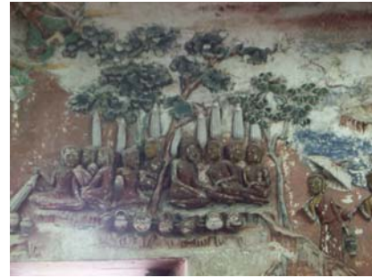
จิตรกรรมฝาผนังนูน วัดบางกะพ้อม