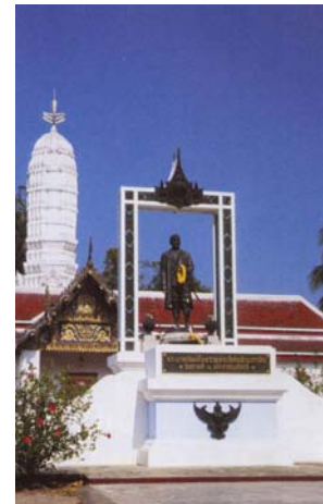
พระบรมราชานุสาวรีย์รัชกาลที่ 2