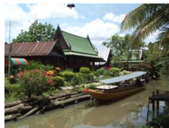
โฮมสเตย์ บริเวณปลายโพงพาง