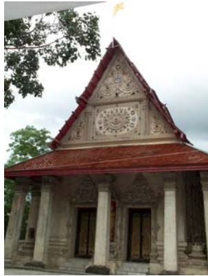
พระอุโบสถวัดเขายี่สาร