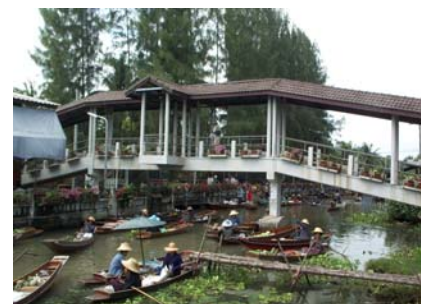
บรรยากาศตลาดน้ำท่าคา