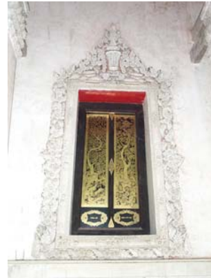
หน้าต่างลงรักปิดทอง