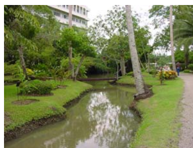
บรรยากาศภายในอุทยาน

วัดอัมพวันเจติยาราม เป็นพระอารามหลวง ตั้งอยู่ที่ปากคลองอัมพวาใกล้กับอุทยานรัชกาลที่ 2 เดิมชื่อว่า “วัดอัมพวา” ตามชื่อตำบล ต่อมาได้เปลี่ยนชื่อมาเป็น “วัดอัมพวันเจติยาราม” ซึ่งมีความหมายว่า “สวนมะม่วงอันร่มรื่นเกษมสำราญเป็นที่เคารพบูชา” เป็นวัดสำคัญคู่กับวัดสุวรรณดารารามในจังหวัดพระนครศรีอยุธยา ซึ่งเป็นวัดประจำราชวงศ์จักรีทางฝ่ายพระบาทสมเด็จพระพุทธยอดฟ้าจุฬาโลกมหาราช รัชกาลที่ 1 วัดอัมพวันเจติยารามเป็นวัดประจำราชินิกุลทางฝ่ายสมเด็จพระอัมรินทรามาตย์ พระราชินีในรัชกาลที่ 1 พระอุโบสถมีลักษณะทรงแบบพระอุโบสถวัดสุวรรณดารารามสันนิษฐานว่าสร้างในสมัยรัชกาลที่ 1 และซ่อมแซมครั้งใหญ่ในสมัยรัชกาลที่ 3 ภายในมีพระประธาน ซึ่งได้ฐานพระประธานบรรจุพระอัฐิของสมเด็จพระรูปศิริโสภาคย์มหานาคนารี และมีภาพจิตรกรรมฝาผนังพระอุโบสถ ซึ่งเขียนเรื่องราวเกี่ยวกับวรรณคดีไทย เช่น เรื่องไกรทอง สังข์ทอง คาวี อิเหนา และเรื่องพระบรมราชาภิเษกใน รัชกาลที่ 2 ซึ่งเรื่องนี้อยู่บริเวณผนังระหว่างประตูพระอุโบสถ เป็นภาพการเสด็จพระราชดำเนินเลียบพระนคร โดยกระบวนพยุหะยาตราทางสถลมารค ภาพตรงส่วนนี้เป็นส่วนที่สมเด็จพระเทพรัตนราชสุดาฯ สยามบรมราชกุมารี ทรงลงฝีพระหัตถ์พระพักตร์พระบาทสมเด็จพระพุทธเลิศหล้านภาลัย ภาพหน้าทวารกลาง และต้นไม้ข้างป้อมริมกำแพง ถือเป็นปฐมในการเขียนภาพจิตรกรรมฝาผนังนี้