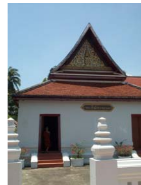
พระที่นั่งทรงธรรม