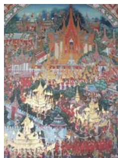
พระอุโบสถวัดอัมพวันเจติยารามและภาพจิตรกรรมฝาผนัง