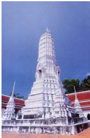
พระปรางค์บรรจุพระบรมอัฐิของรัชกาลที่ 2

นอกจากนี้ภายในวัดยังมีพระปรางค์สีขาว ซึ่งสร้างในบริเวณสถานที่ประดิษฐานของพระบาทสมเด็จพระพุทธเลิศหล้านภาลัย รัชกาลที่ 2 และเป็นที่บรรจุพระบรมสรีรังคารของพระองค์เอาไว้เป็นอนุสรณ์ที่กราบไหว้ของพสกนิกร บริเวณใกล้ๆ กันมีพระที่นั่งทรงธรรม ภายในมีพระประธาน 1 องค์และมีพระบาท 4 รอยอยู่ด้านหน้า มีความหมายถึงพระพุทธเจ้า 4 องค์ที่ตรัสรู้แล้ว ภายในบริเวณวัด ยังมีพระบรมราชานุสาวรีย์รัชกาลที่ 2 ประดิษฐานอยู่ด้วย