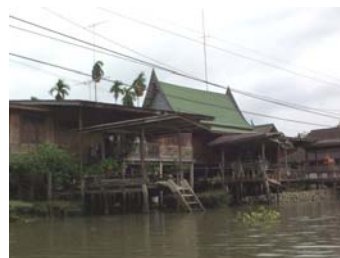
โฮมสเตย์ บริเวณคลองแค่อ้อม