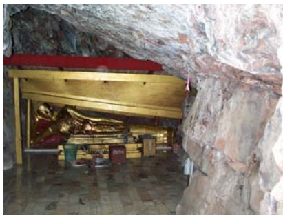
พระนอนในถ้ำภายในวัดเขายี่สาร