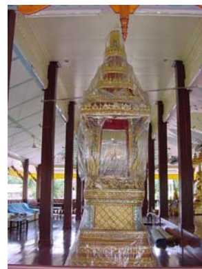
บุษบก สำหรับแสดงธรรมเทศน์ ภายในวัดพวงมาลัย