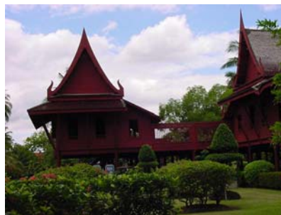
หมู่บ้านเรือนไทย