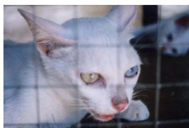
เรือนเพาะเลี้ยงแมวไทย