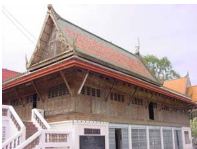
พระอุโบสถวัดบางแคใหญ่

วัดบางแคใหญ่ ตั้งอยู่ริมแม่น้ำแม่กลอง สร้างขึ้นเมื่อ พ.ศ.2357 ภายในวัดมีโบราณสถานและโบราณวัตถุที่น่าสนใจ ได้แก่ พระอุโบสถหลังใหญ่อายุกว่า 150 ปี ด้านหน้ามีเจดีย์เหลี่ยมย่อมุมสิบสอง ศิลปะสมัยกรุงศรีอยุธยา พระประธานในอุโบสถปั้นด้วยศิลาแลง ปางมารวิชัย ด้านหน้าพระอุโบสถมีธรรมเจดีย์ 7 องค์ สร้างเมื่อ พ.ศ.2415 มีกำแพงแก้วล้อมรอบ และมีภาพจิตรกรรมฝาผนังบนฝาประจัน กุฏิสงฆ์ ที่เขียนด้วยสีฝุ่นผสมกาวเขียนขึ้นในปลายรัชกาลที่ 2 เป็นภาพเรื่องราวการทำสงครามไทย-พม่า