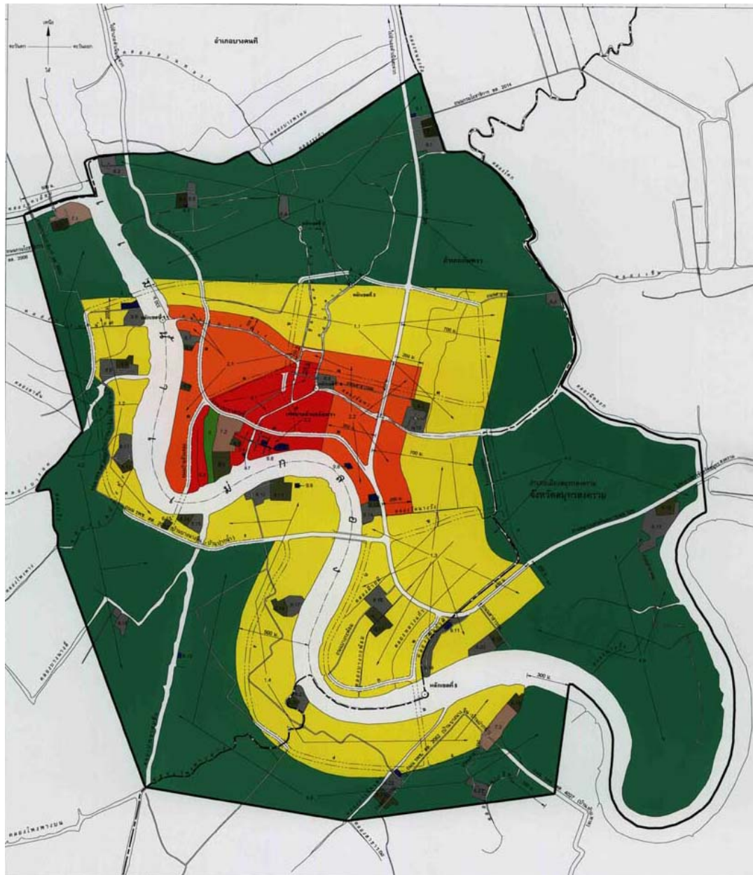
แผนที่ที่ 3.1 แสดงผังเมืองรวมเมืองอัมพวา อำเภออัมพวา จังหวัดสมุทรสงคราม