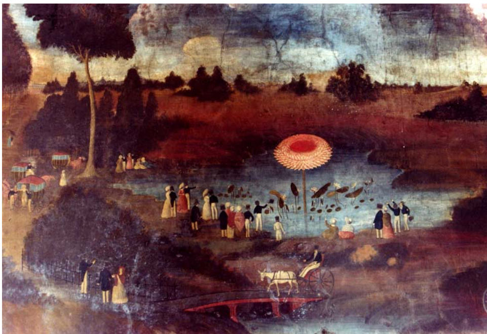
ภาพปริศนาธรรมห้องที่ 4