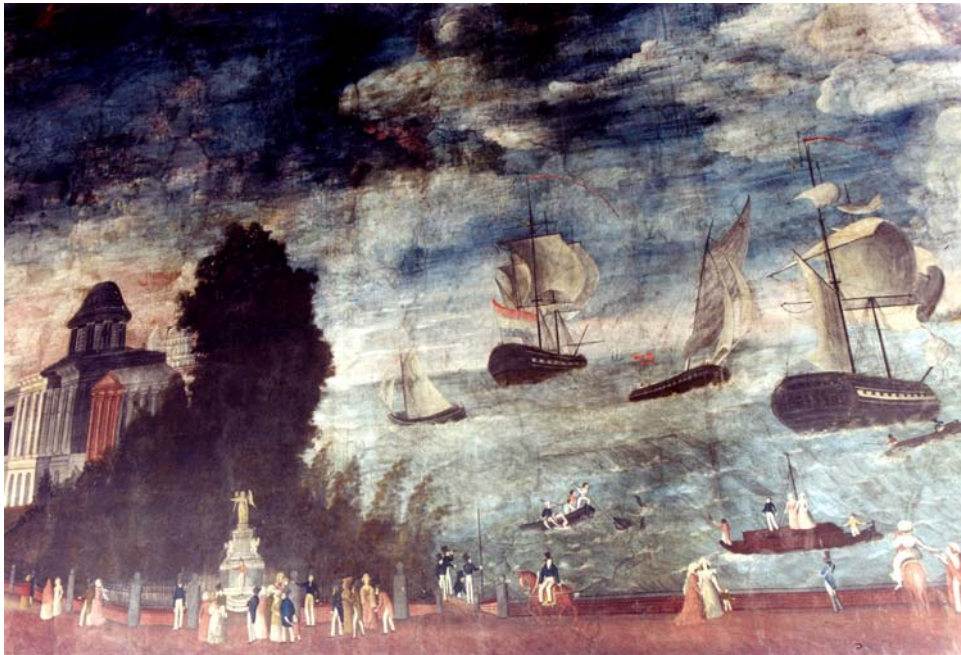
ภาพต่อเนื่องปริศนาธรรมห้องที่ 1

ภาพปริศนาธรรมห้องที่ 1 อุปมาว่า มีเมืองแห่งหนึ่งน่าสนุกสนานปราศจากโรคภัย แต่อยู่ไกลคนไปยาก มีบุคคลผู้ฉลาดเห็นแก่คนทั้งปวง มาตั้งบ้านเรือนอยู่ต้นทาง คอยบอกทางผิดชอบแก่คนทั้งหลาย ผู้เดินทางถูกก็ได้ความสุข ผู้เดินทางผิด ก็ได้ความทุกข์ อุปมาเมืองเกษมแห่งนี้คือ พระนิพพาน ทางตรงและทางอ้อมคือข้อปฏิบัติผิดชอบ บุรุษผู้ฉลาดคือพระพุทธเจ้า คำแสดงหนทางคือพระธรรมเทศนา ผู้เดินทางถูกคือพระอริยสงฆ์เจ้า ผู้เดินทางผิดคือบุคคลผู้ปฏิบัติผิดได้ความทุกข์